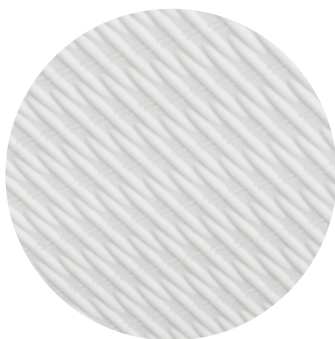
White wicker (osier blanc)

Colori pales : 5 pales White wicker (osier blanc)