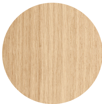
Light oak (chêne clair)

Dimensions : diam. 112 cm (hauteur tige d'origine 7,5cm )