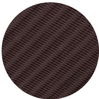
Antique dark wicker (osier brun foncé)

Colori moteur : New Bronze (bronze foncé) Colori pales : 5 pales Antique dark wicker (osier brun foncé)