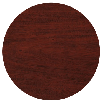
Dark cherrywood (cerisier)

Colori moteur : New Bronze (bronze foncé) Colori pales: 5 pales Dark cherry (cerisier) / Medium Oak (chêne)