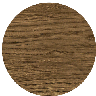
Medium oak (chêne)

Dimensions : diam. 112 cm (hauteur tige d'origine 7,5cm )