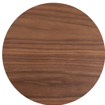
Yellow walnut (noyer)

Dimensions : diam. 132 cm (hauteur tige d'origine 7,5cm )